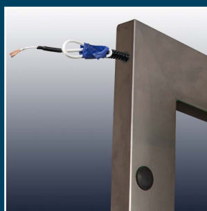
przewód w ościeżnicy