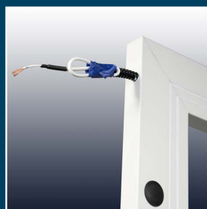
przewód w ościeżnicy