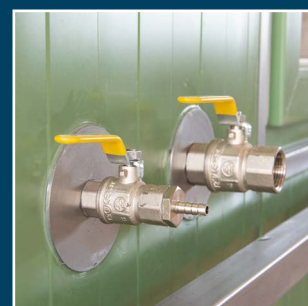
2 zawory kulowe